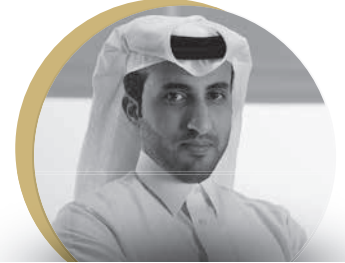
فيصل راشد السحوي

في العام 2009 أنشئت محكمة قطر الدولية بموجب أحكام القانون رقم ٧ لسنة 2005 و تعديلاته ضمن الإطار القانوني المنظم لمركز قطر للمال ومنذ العام 2012 تم إجازة تسمية المحكمة بمحكمة قطر الدولية، وذلك بناء على قرار مجلس الوزراء رقم 17 لسنة 2012. وقد جاء إنشاء المحكمة لتكون الذراع القضائي لمركز قطر للمال وذلك من خلال توفير قضاء متخصص يوفر حلول ناجعة وسريعة مبنية على أفضل المعايير الدولية لحل النزاعات الناشئة في المركز. وعلى مدار العقد المنصرم حرصت المحكمة على تطوير خدماتها القضائية المقدمة، الأمر الذي ساهم في جعلها محكمة رائدة على المستوى الدولي عززت بها بيئة المال والأعمال في الدولة في الوقت الذي يشهد فيه الاقتصاد الوطني نمو مضطرد مما جعلها مركزا ماليا فريدا في المنطقة.