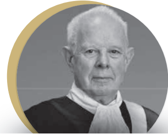
سعادة اللورد جون توماس