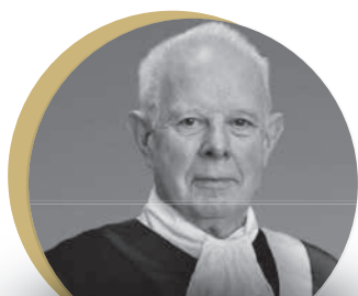
The Rt. Hon Lord Thomas of Cwmgiedd President of the Qatar International Court